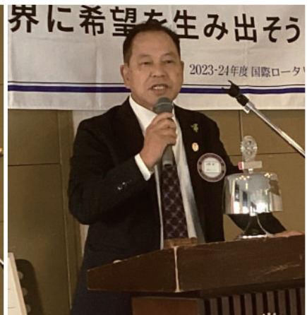
山崎会員 広島親睦旅行報告