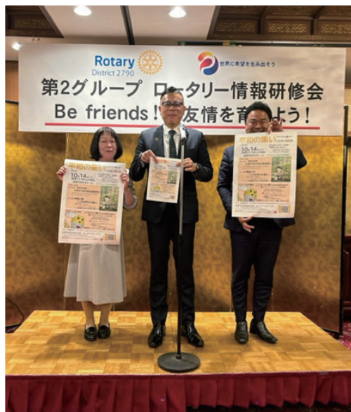
三須会長、平和の集い告知