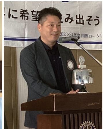
長野会員 委員会報告