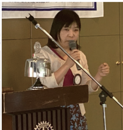
水庫会員 広島平和記念館報告